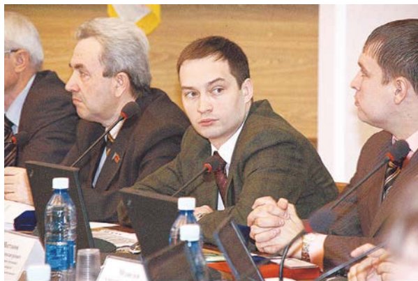
Специалисты комиссии по бюджету и налоговой политике рассматривали отчеты о выполнении наказов.

Также на комиссии рассматривались вопросы, касающиеся программы капитального ремонта и мер по реализации Постановления Правительства Российской Федерации от 23.10.2010 № 731 «Об утверждении стандарта раскрытия информации организациями, осуществляющими деятельность в сфере управления многоквартирными домами». Последний вопрос стоит достаточно остро, поскольку ни для кого не секрет, что взаимоотношения собственников с управляющими организациями имеют довольно-таки сложный характер. Кроме того, рассматриваются такие актуальные вопросы, как ремонт дворовых территорий многоквартирных домов, модернизация лифтов жилищного фонда в городе, благоустройство улиц частного сектора города Новосибирска. Все эти