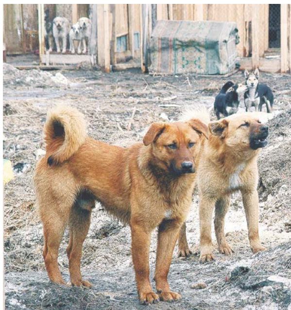
Решать проблему беспризорных животных нужно цивилизованно.

Специалисты отмечают: чтобы свести на нет количество нападений бездомных псов на людей, необходимо позаботиться, чтобы в городе не осталось не одной бесхозной собаки. Самый гуманный способ - распределить брошенных дворняг по питомникам. Но на практике оказывается, что это не так-то просто. В Новосибирске всего три приюта для бездомных животных. Расположены они в Дзержинском районе, Академгородке и на ВАСХНИЛе. Специалисты отмечают, что для такого крупного города, как Новосибирск, этого недостаточно. К тому же сами приюты переживают сейчас не лучшие времена. Например, общественность всколыхнул пожар, который произошел этой зимой в «Надежде» - приюте Академгородка. Эта ситуация дала понять, что у нас в городе немало равнодушных людей, согласных помогать бескорыстно. Но решить все проблемы, даже несмотря на поддержку горожан, так и не удастся. Уже сейчас приют переполнен. И такая ситуация характерна не только для Академгородка, но и для остальных подобных учреждений города. Еще одна проблема всех пристанищ для животных - нехватка кадров. Ухаживать за собаками некому. Вот с этим новосибирские зоозащитники справились своими силами.