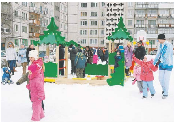
В текущем году во всех районах Новосибирска на придомовых территориях планируется установить 252 детских игровых городка на общую сумму 50 млн. рублей.

Члены комиссии по городскому хозяйству Совета депутатов города Новосибирска обсудили финансирование мероприятий по текущему содержанию и ремонту детских игровых площадок, расположенных на придомовых территориях многоквартирных жилых домов.