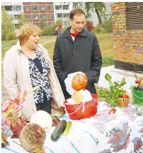
Садоводы представили выращенные на собственных огородах овощи