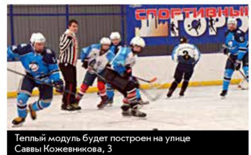
Теплый модуль будет построен на улице Саввы Кожевникова, 3

Кстати о дворовом спорте. В Кировском районе это направление развивается особенно активно, ведь так?