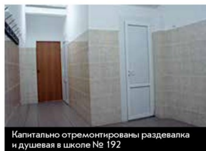
Капитально отремонтированы раздевалка и душевая в школе № 192