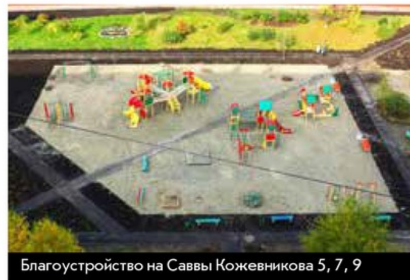
Благоустройство на Саввы Кожевникова 5, 7, 9

– В 2017 году был реализован крупный наказ: у домов по улице Саввы Кожевникова, 5, 7 и 9 прошло комплексное благоустройство территории. Старшие советы домов самостоятельно написали проект и получили федеральное финансирование по программе «Городская среда» в размере 5 млн 950 тыс. рублей. Плюс ко всему, на данной территории реализован еще один наказ – были установлены уличные тренажеры, детский городок и спортивная площадка. На эти цели потрачено 1 млн 250 тыс. рублей.