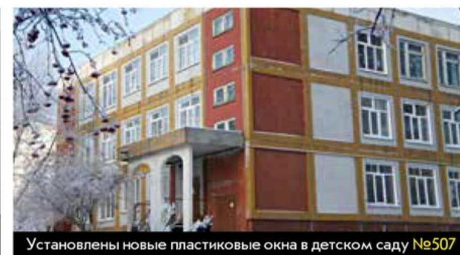
Установлены новые пластиковые окна в детском саду №507