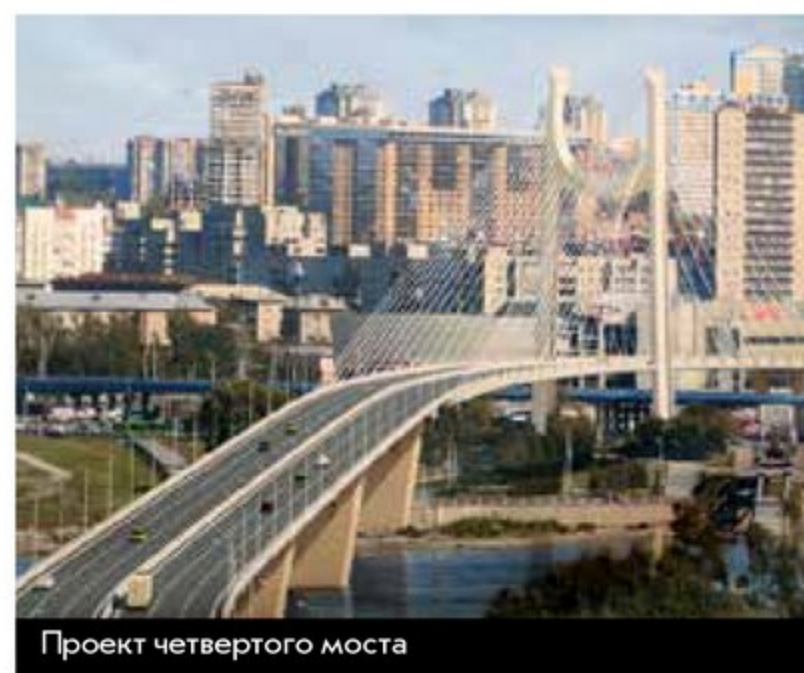
Проект четвертого моста

Кому-то необходим комфорт, кто-то не захочет стоять в пробке.