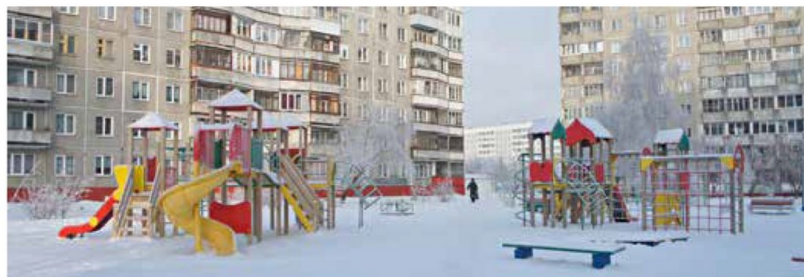
С 2006 года на 18-м округе установлены 93 детских городка