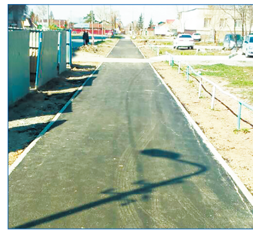
Теперь так выглядит тротуар на улице Степной