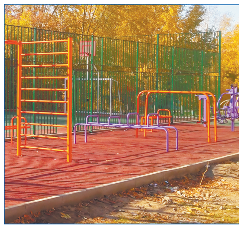
Во многих дворах появились спортплощадки