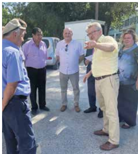
На строительной площадке будущего современного стадиона

Действительно, средства на реализацию проекта были выделены из городского бюджета, а также из средств, выделяемых на выполнение обращений граждан, горсовета и Законодательного собрания. По мнению Николая Тямина, такой опыт можно распространить на весь город: