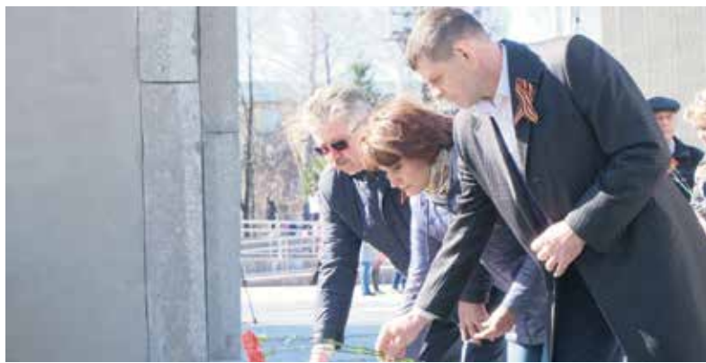
Сохранение исторической памяти. С коллегами-депутатами на возложении цветов в преддверии Дня Победы

сомневаюсь, когда эпидемиологическая ситуация стабилизируется, мы выйдем на уровень 100% исполнения. Как бы то ни было, пандемия заставила нас по-новому взглянуть на многие проблемы. Знаете, как в народе говорят: не было бы счастья, да несчастье помогло. Например, совсем другой меркой мы сегодня оцениваем и медицинскую инфраструктуру, и труд медицинских работников, который долгие годы был откровенно недооценен и властью, и обществом. Поддерживать людей в белых халатах, выразить им признательность за напряженный труд — просто необходимо. Мы традиционно это делаем в торжественной обстановке в ДК «Металлург» в День медицинского работника. Поздравить врачей, медицинских сестер и персонал лечебных учреждений Ленинского района пришли депутаты Государственной думы, Законодательного собрания области, Совета депутатов города Новосибирска. Был замечательный концерт от артистов КДЦ им. К.С. Станиславского и Государственного академического Сибирского русского народного хора. Однако отмечу, что для до-