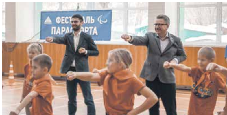
Движение вперед доступно каждому. На открытии Фестиваля параолимпийского спорта

В 2020 году избиратели в пятый раз доверили ему право представлять их интересы в Совете депутатов города Новосибирска. Решением первой сессии Совета депутатов города Новосибирска седьмого созыва, состоявшейся 25 сентября 2020 года, был избран заместителем председателя Совета депутатов города Новосибирска.