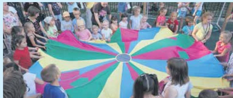
А что нужно для крепкой семьи? Места для отдыха и спорта! На открытии спортивной площадки для детей на Станиславского, 26.

Таких примеров немало в нашем районе — люди знакомились на производстве, уезжая на целину. Такая вот, с позволения сказать, рабочая романтика. И ведь крепкие получились семьи. Всякое было, и горе, и радости. Но главное — они все пережили вместе.