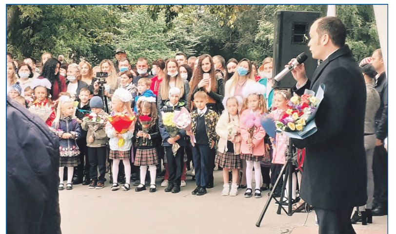
1 сентября в 43-й школе