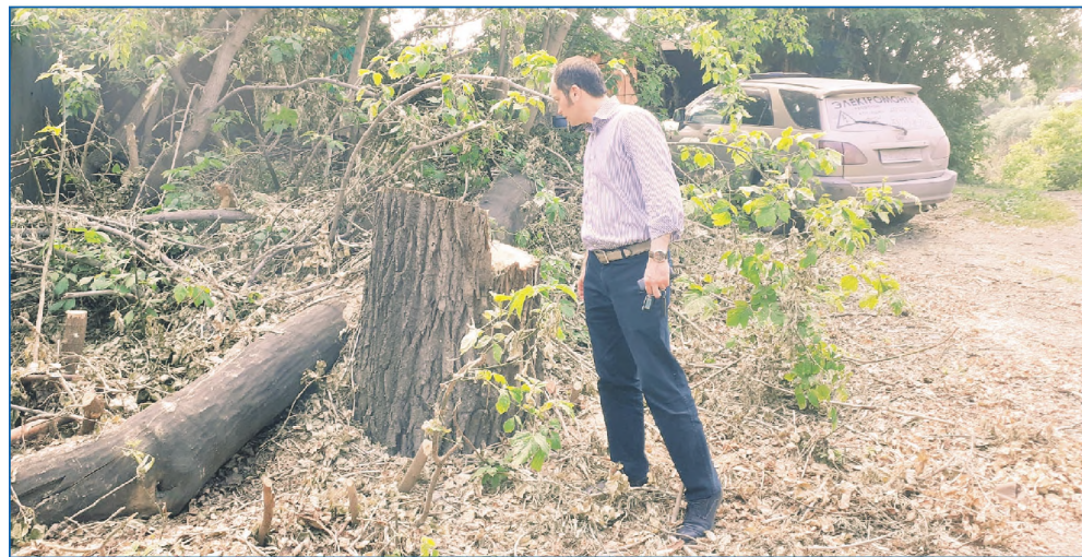
Контроль спила аварийных деревьев на ул. Ногина