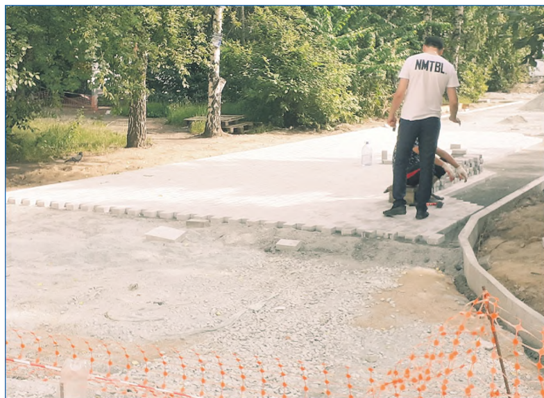
Реконструкция сквера на площади Лунинецов

Рядом с домом на ул. Владимирской, 21, развернулась