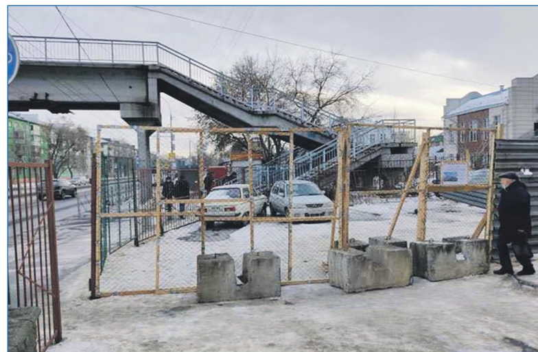
Строительный забор рядом с домом по улице Владимирская, 21

Да потому, что если бы они строили объект капитальный, а площадь земельного участка это позволяет, им пришлось бы половину территории в соответствии со строительными нормативами отдать под проезды и парковки. А так они надеются максимально всю площадь занять павильоном, и все. Такой бизнес — это, наверное, не то, что нужно городу. В настоящий момент продолжается борьба жителей против