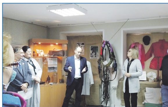
В музее Железнодорожного района

Даже в давно сформированных жилых кварталах может не хватать путей движения для пешеходов — например, много лет отсутствовал тротуар у школы №43 со стороны дома №14 по ул. Дуся Ковальчук. Благодаря внесению тротуара в наказа, удалось добиться его оперативного сооружения.