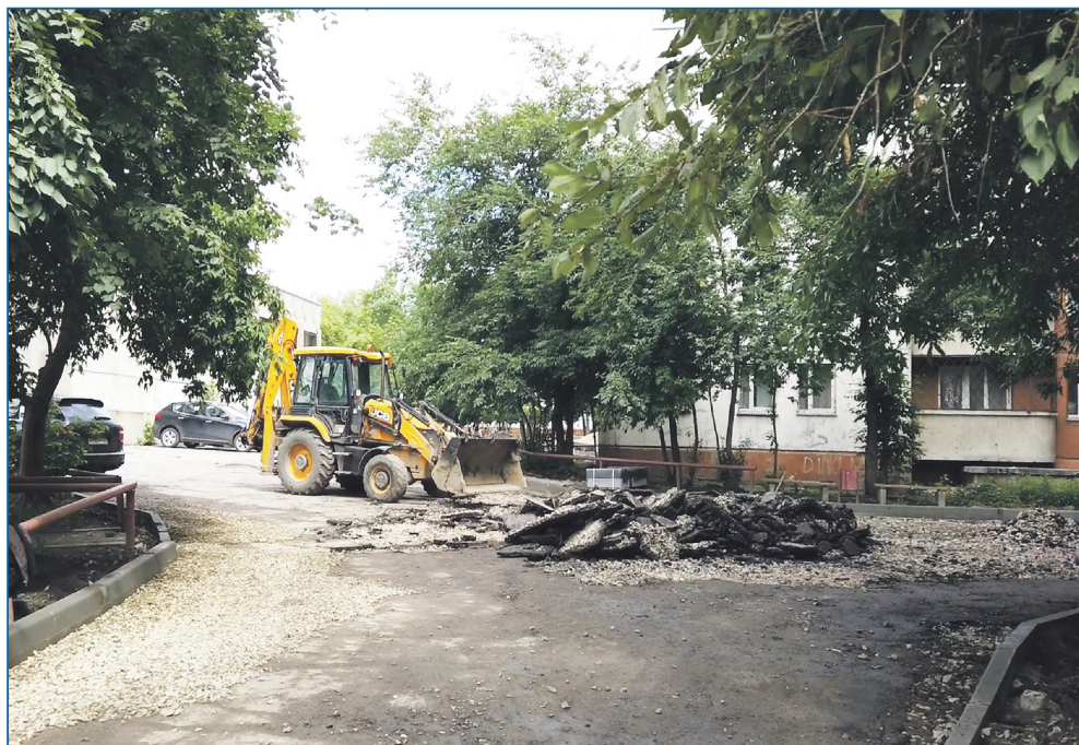
Ремонт двора по ул. 1905 года, 21