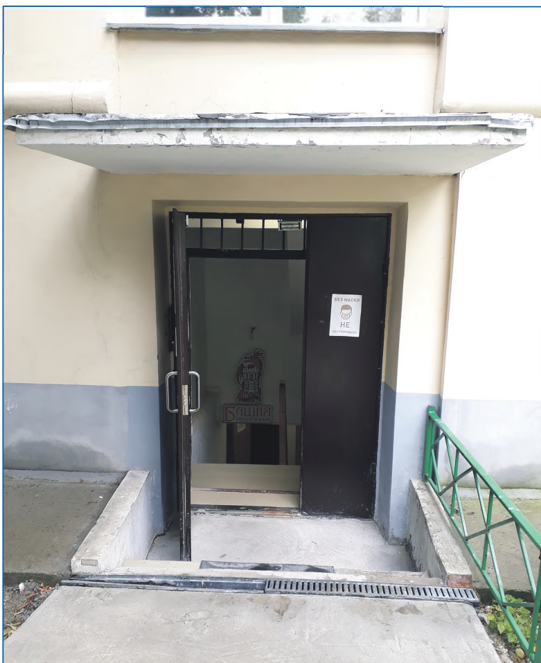
Вход в кальянную на ул. Челюскинцев, 7

В свое время мэрия довольно активно продавала принадлежащие городу подвалы в многоквартирных домах. И в одном из них в доме по ул. Челюскинцев, 5, новые владельцы организовали кальянную. Все бы ничего, если бы они предусмотрели собственную вентиляцию с выводом запахов и дыма на крышу здания. Но этого не произошло. И конечно, граждане пришли в ужас, ког-