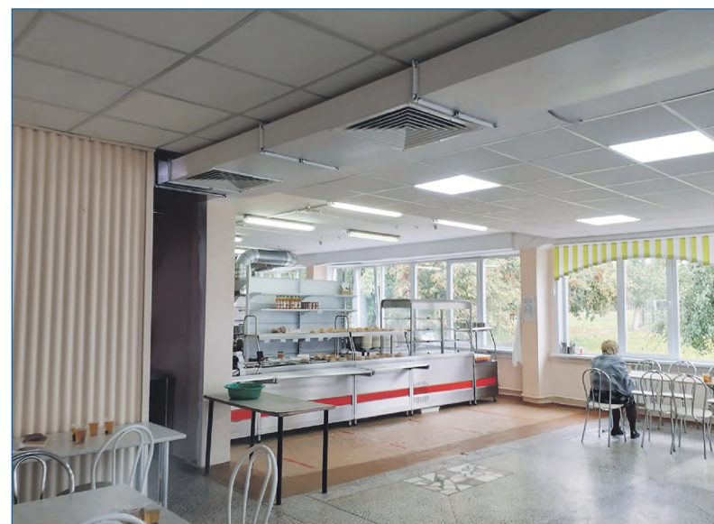
Реконструкция столовой 137-й школы

Вместе с тем развивать эту территорию, реконструировать необходимо, потому что сама лыжная база в ее нынешнем виде в техническом плане находится в неудовлетворительном состоянии.