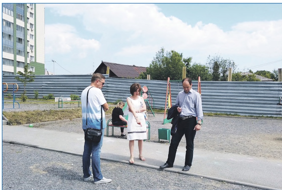
Совещание по определению места установки детской площадки на ул. Сухарной, 96/2

«Территория детства» современной детской площадки на Сухарной, 96/2. Также, благодаря усилиям администрации, подрядчиков и жителей округа удалось установить спортивные элементы на Сухарной, 78, несмотря на не вполне удобное расположение площадки.