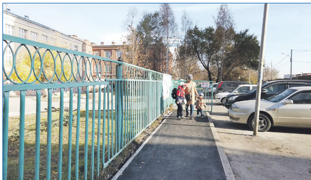
Новый тротуар вдоль ограды школы №43