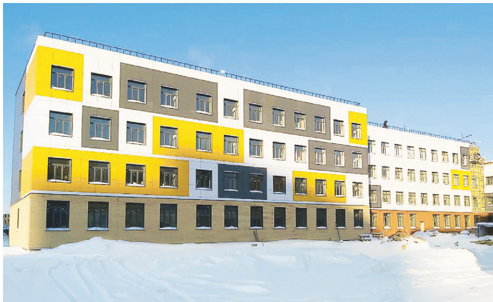
Инфраструктура совершенствуется каждый год

чатова), «Школа», «Земнухова», «Краузе», «Магазин «Радуга», «Жилмассив Родники», «Свечникова» ✓ Запущен светофор на пересечении улиц Мясникова и Гребенщикова ✓ Выполнено благоустройство 8 придомовых территорий ✓ Установлены детские городки ✓ Отремонтирована библиотека ✓ Выполнен ремонт вентиляций, пищеблоков ✓ Выполнен ремонт тротуаров, лестниц ✓ Полностью заменены деревянные окна на пластиковые в борцовском зале центра «Лидер», в детском саду № 122, школах № 8, 203, 207 ✓ Открыт филиал Школы искусств № 17