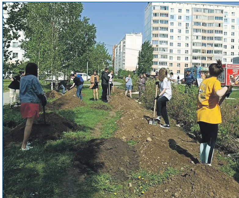
В рамках акции «Сад памяти» в сквере по улице Свечникова были высажены кустарники

Специфика работы комиссии по социальной политике и образованию и комиссии по местному самоуправлению кардинально разная. Понятно, что на сессию выносятся только готовые вопросы. Если тема резонансная, при необходимости проводится так называемая предкомиссия — круглые столы, заседания, на которые приглашаются ответственные по вопросу департаменты. Они нужны, чтобы детально обсудить вопрос со всех сторон или успеть внести какие-то корректировки. На самой комиссии принимается решение, будет ли вопрос вынесен на сессию, и дается рекомендация либо к его принятию, либо к отклонению.