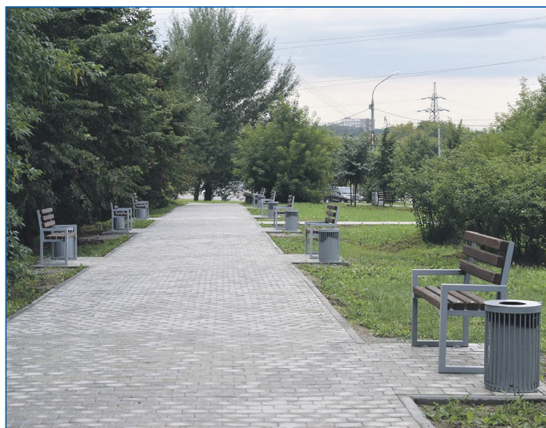
Реализация наказа по благоустройству и озеленению сквера около дома Тюленина, 1