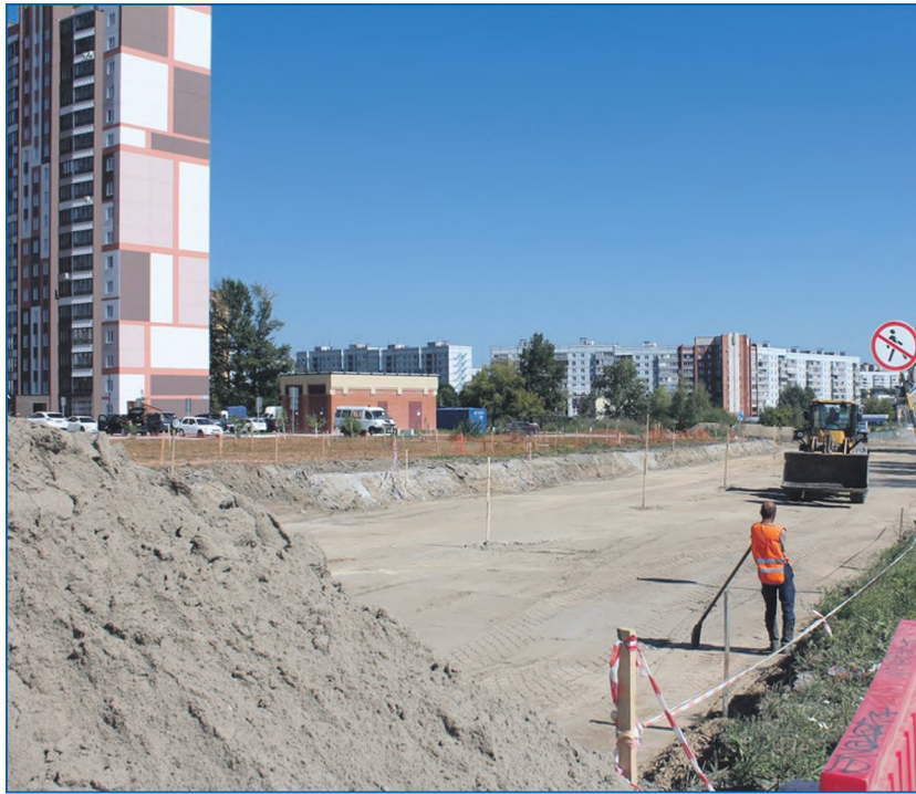
Строительство улицы Мясниковой

Конечно, важны вопросы ремонта тротуаров, проезжих частей, улиц, фасадов зданий, установка освещения. Остро стоит вопрос городской пыли. То есть вопросов достаточно много. Все они в большей степени системные и требуют планомерной работы — например, приобретения уборочной техники, которую за раз не купишь, поскольку для этого нужны значительные средства. Департаменты и мэрии