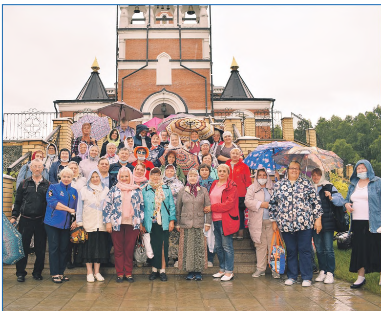
Для жителей округа ежегодно организовываются поездки по святым местам