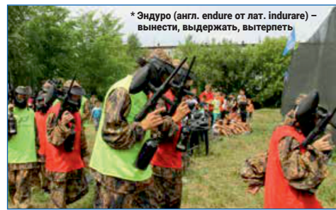
*Эндуро (англ. endure от лат. indurare) — вынести, выдержать, вытерпеть

И здесь, на «Зарнице», ребята как раз этим и занимаются. Они чувствуют плечо товарища, работают командой, защищая здесь честь школы, — считает Дмитрий Асанцев. ■