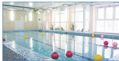
Проведен капитальный ремонт бассейна в школе №196

— Значительную часть наказов занимает сфера образования. Практически во всех школах и детских садах поменяли окна на пластиковые, установили системы видеонаблюдения, асфальтировали территории, отремонтировали фасады. Самые значимые и затратные наказы — капитальные ремонты спортивных залов в школах 196 и 192. Ремонт бассейна в 196 школе закончили в 2016 году, финансирование около 8,5 млн рублей. Од-