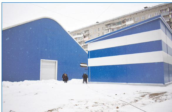
Теплые павильоны и раздевалки рядом с крытыми спорткомплексами построены на Затулинке и на Чемском