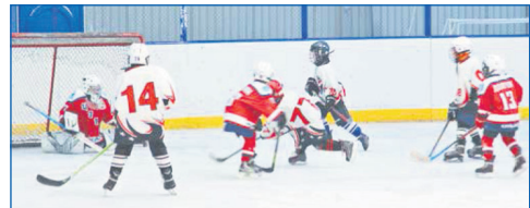
На субсидии депутатов приобретается экипировка для занятий спортом: хоккейная форма для дворовых команд, 500 пар коньков для детей, занимающихся фигурным катанием, клюшки и инвентарь для флорбола, 90 пар палочек для скандинавской ходьбы

Подробный видеодоказ о работе вашего депутата вы можете посмотреть по ссылке https://youtu.be/zTDaBbsCtNU или воспользовавшись приложением для распознавания QR-кода НА ВАШИХ СМАРТФОНАХ