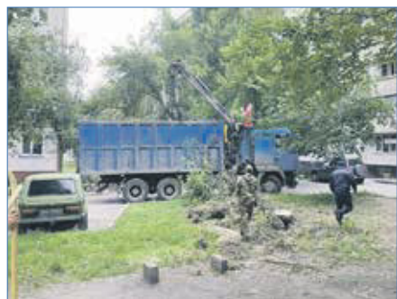
Работы по спилу аварийных деревьев