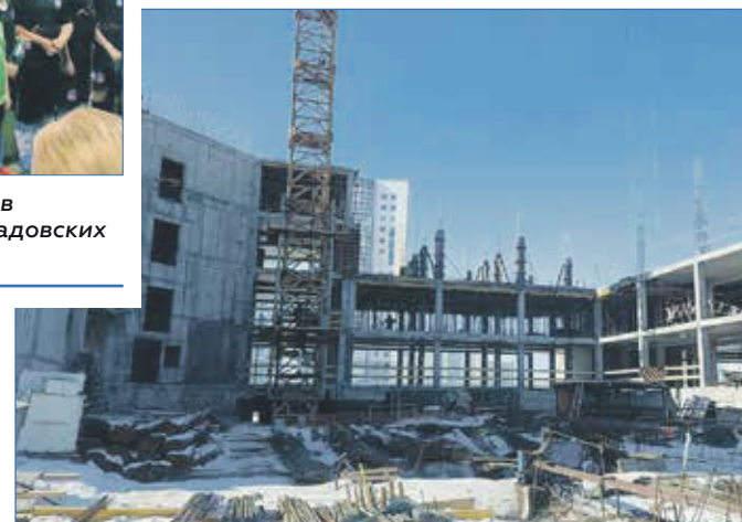
Строительство поликлиники в Кировском районе

Также решено, что депутаты будут возвращаться к вопросам безопасности маршрутов к детским образовательным учреждениям ежеквартально.