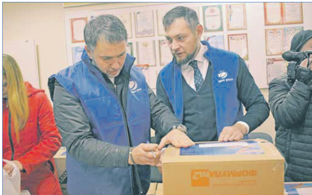
Сбор гуманитарной помощи в Донбасс

почему такая норма не была закреплена в законе раньше. Возможно, никому и никогда в голову не приходило, что человек, который активно вел предвыборную кампанию, который, победив конкурентов, стал депутатом, может вот так запросто бросить все и всех. Возможно, в каких-то городах, приводя в соответствие с законом местные Уставы, парламентарии даже удивлялись, зачем вносится такая норма. И это вполне разумная реакция, потому что такое поведение депутата — безответственно и недопустимо. И очень хорошо, что многие коллеги из других регионов восприняли поправку как «дежурную», на всякий случай, чтобы «припугнуть». Новосибирску в этом плане повезло гораздо меньше, в нашем городе создан прецедент, и мы посчитали необходимым таким образом предупредить подобные ситуации в других городах.