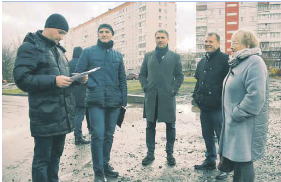
Обсуждение благоустройства на улице Герцена

— Действительно, в этом созыве мы впервые столкнулись с таким явлением, как «депутат-призрак», когда формально избранный депутат существует, но физически его долгое время нет в городе и даже стране. Надо ли говорить, что от этого страдают жители округа, которые доверили ему представлять их интересы? Люди от безысходности идут с проблемами своих территорий к депутатам-соседям. А у них не всегда достаточно полномочий решать вопросы на других округах. Мы уже долгое время на сессиях наблюдаем два пустых кресла и считаем такую ситуацию недопустимой. Я могу объяснить,