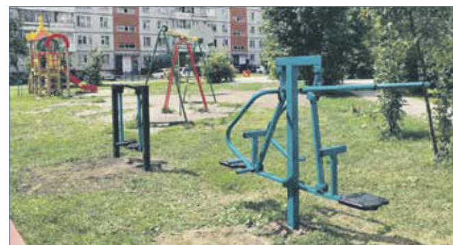
Установка детского спорткомплекса по ул. Саввы Кожевникова, 19

Это важно не только тем, кто сейчас в зоне спецоперации, это очень нужно всем нам: почувствовать себя одной страной, в очередной раз убедиться, что все вместе мы — огромная движущая сила, способная на очень многое. Это наше общее дело!