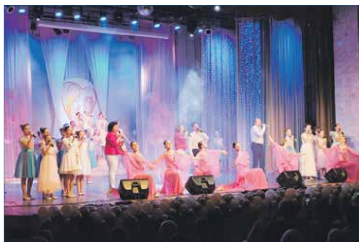
В КДЦ им. Станиславского на праздник-концерт, посвященный Дню Матери, гости приходили целыми семьями — поддержать своих мам и бабушек и порадоваться за них