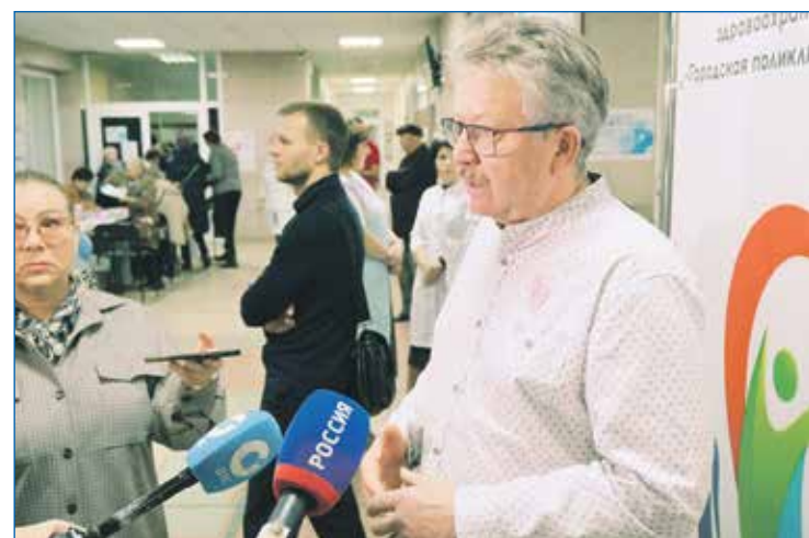
Продолжение медицинской акции «День семейного здоровья в поликлинике №24 на улице Станиславского. Жители смогли получить консультации дерматолога, онколога, терапевта, гинеколога, уролога