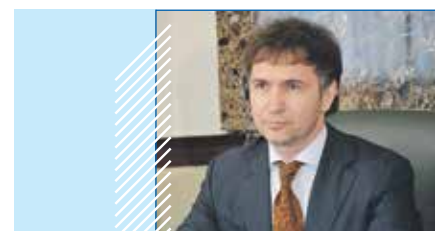
Дмитрий АСАНЦЕВ, Председатель Совета депутатов города Новосибирска:

Для такой страны, как Россия, существование без суверенитета невозможно, ее просто не будет, во всяком случае, в том виде, в котором она сегодня существует и в котором существовала тысячу лет. Поэтому главное — укрепление суверенитета. Но это очень широкое понятие. Укрепление суверенитета внешнего, это значит — укрепление обороноспособности страны, безопасности по внешнему контуру, это укрепление общественного суверенитета. Это безусловное обеспечение прав, свобод граждан страны, развитие нашей политической системы, парламентаризма. И наконец, это обеспечение безопасности и суверенитета в сфере экономики и технологического суверенитета.