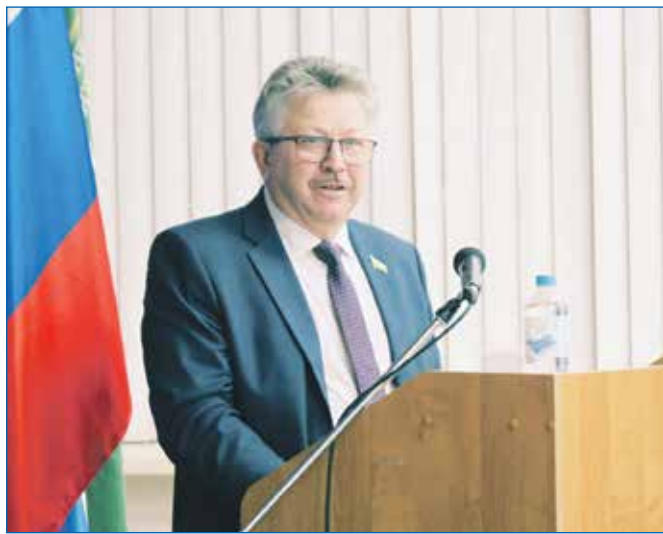
Желающих побывать на отчете о работе депутата Николая Тямина набралось так много, что всех едва вместил актовый зал Новосибирского колледжа парикмахерского искусства

● Установлена детская площадка со спортивными элементами по адресу: ул. Немировича-Данченко, 20.