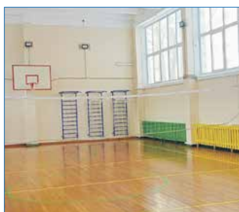
Отремонтированный спортзал школы № 15