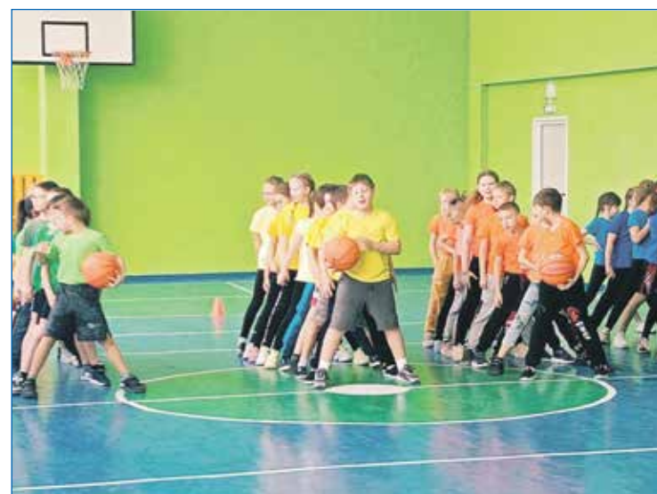
Недавно отремонтированный спортивный зал в школе №187 не стоит без дела ни дня