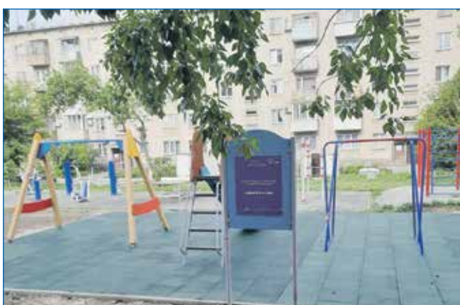
Хороший пример совместной работы с активистами многоквартирных домов по ул. Станиславского, 26, и ул. Степной, 43. Благодаря их настойчивости и активной жизненной позиции депутаты добились включения этого адреса в программу «Город детства». Вместо пустыря теперь здесь отличная игровая площадка со специальным покрытием, безопасным для детей