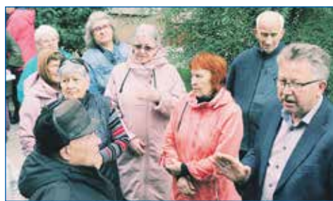
Встреча с жителями дома №69 по улице Степной