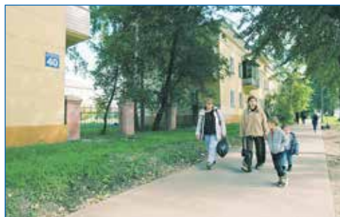
В 2023 году произведен ремонт асфальтового покрытия в нескольких дворах и на тротуаре вдоль улицы Титова