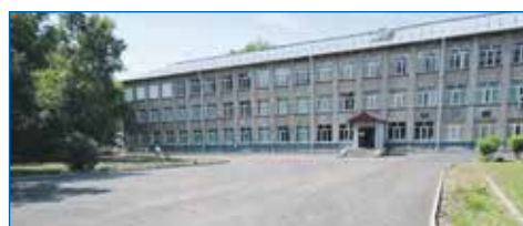
Полностью завершено асфальтирование территории школы №20