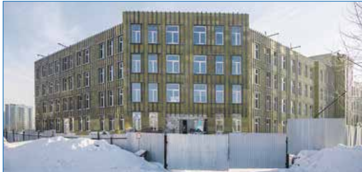
Строительство поликлиники №13

Это накладывает на нас большую ответственность. Я обращаюсь к читателям. Сейчас не время поиска истины в спорах, сейчас время объединения. Если мы не объединимся, нас развалят. Ничего нет лучше, чем посеять смуту и вражду внутри страны, это может привести к гражданской войне, и тогда уже будут не нужны никакие внешние усилия. Такой исторический опыт у нас тоже, к сожалению, есть. Я считаю, мы не можем повторять прошлых ошибок. Призываю 15-го, 16-го и 17 марта объединиться и показать всем, кто не с нами, что Россия все-таки сильна тем, что люди в сложные времена умеют и могут быть вместе.