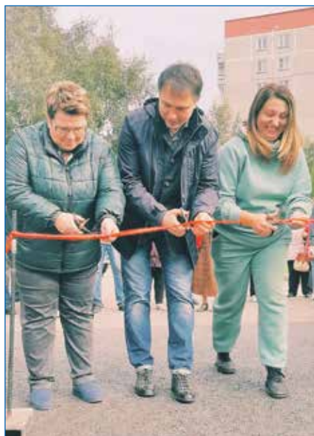
Открытие долгожданной дороги на ул. Герцена

Хочу обратить внимание, что скоро начнется и новый этап голосования за выбор территории по федеральной программе партии «Единая Россия» «Городская ком-