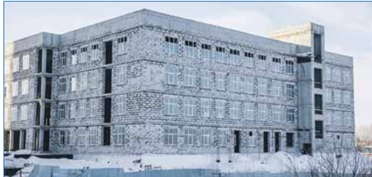
Строительство поликлиники №22