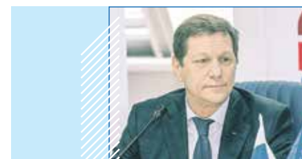
Александр ЖУКОВ, первый заместитель председателя Государственной Думы:

Для такой страны, как Россия, существование без суверенитета невозможно, ее просто не будет, во всяком случае, в том виде, в котором она сегодня существует и в котором существовала тысячу лет. Поэтому главное — укрепление суверенитета. Но это очень широкое понятие. Укрепление суверенитета внешнего, это значит — укрепление обороноспособности страны, безопасности по внешнему контуру, это укрепление общественного суверенитета. Это безусловное обеспечение прав, свобод граждан страны, развитие нашей политической системы, парламентаризма. И наконец, это обеспечение безопасности и суверенитета в сфере экономики и технологического суверенитета.