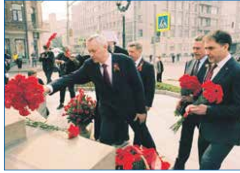
9 мая 2023 года: возложение цветов к памятнику трижды герою Советского Союза А.И. Покрышкину

— На мой взгляд, она отличается международными событиями и тем, как сейчас радикально поделится мир. Не буду искать