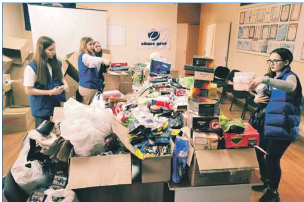
Гуманитарный сбор для воинов СВО, поддержка их семей начата с первых дней и продолжается сегодня

Мы могли, конечно, зафиксировать в законе площадь и 100 кв.м, но тогда бы под ограничения попали и добросовестные предприниматели, которые в цивили-