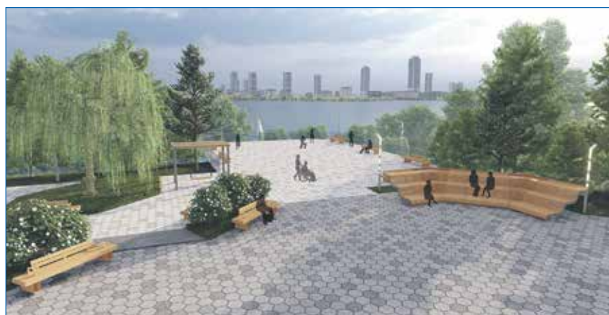
Проект «Набережная на улице Саввы Кожевникова»: главная площадь и смотровая площадка с видом на Обь