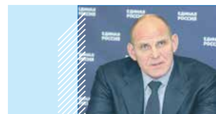
Александр КАРЕЛИН, член Совета Федерации от Новосибирской области:

— Под руководством Владимира Владимировича Путина страна прошла большой путь, направленный на улучшение качества жизни людей, развитие экономики, науки, культуры. И сейчас, в период беспрецедентных геополитических изменений, мы сплотились вокруг национального лидера. Под руководством Владимира Владимировича Россия сохранила свои независимость и суверенитет, продолжает поступательное развитие. Статистика убедительно свидетельствует, что Россия не просто успешно противостоит всем вызовам — по итогам 2023 года наблюдается рост экономики, особенно промышленного производства и инвестиций.