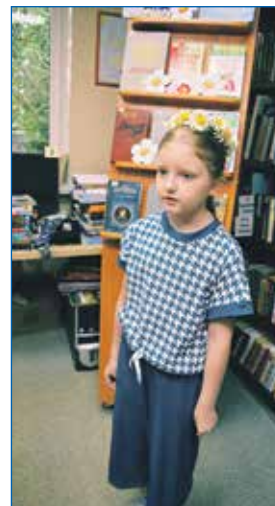
День семьи на округе №39