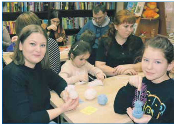
Совместно с Центром семейного чтения «На Плющихе» дети округа готовились к встрече Нового года