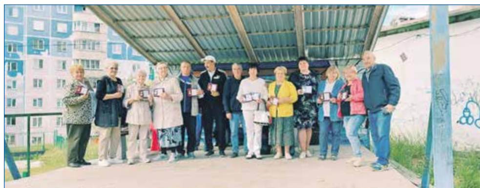
Награждение активистов и общественников округа №39 памятными знаками «За труд на благо города» к 130-летию Новосибирска

— С самого начала специальной военной операции люди со всей страны начали поддерживать бойцов, защищающих Россию, семьи мобилизованных ребят. Хочу поблагодарить жителей моего округа, кто тоже старается помогать всем