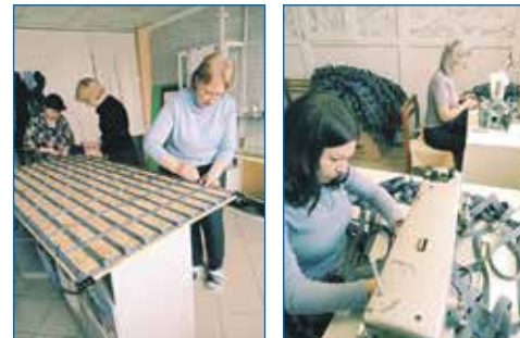
Неравнодушные горожане изготавливают бескаркасные многофункциональные носилки на округе

Впрочем, помимо гуманитарной помощи, новосибирцы оказывают и моральную