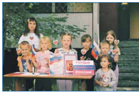
День флага на округе №39 отмечали и взрослые, и дети

■ Установлена хоккейная коробка на территории МБОУ СОШ №194, расположенной по адресу: Новосибирск, ул. Лазурная, 10/1.