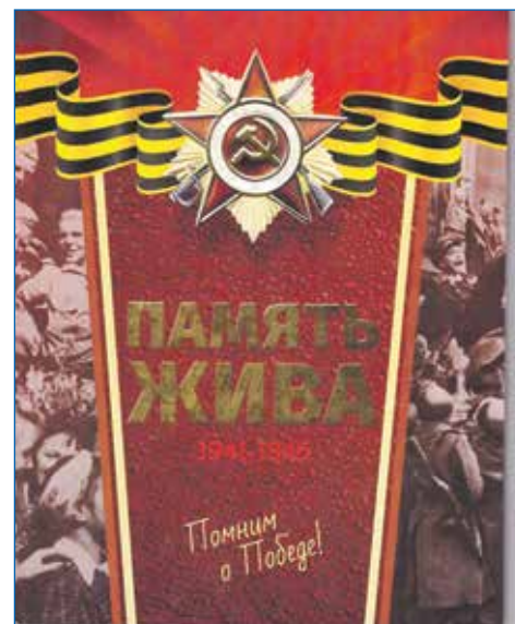
Книга «Память жива» о подвигах новосибирцев в годы Великой Отечественной войны

Кроме того, на очереди издание книг, посвященных событиям недавнего прошлого и связанных с афганской и чеченской войнами. Авторы проекта обращаются к участникам этих событий, их близким и родственникам с просьбой поделиться воспоминаниями, фотографиями, и всем, что сохранилось в семейных архивах.