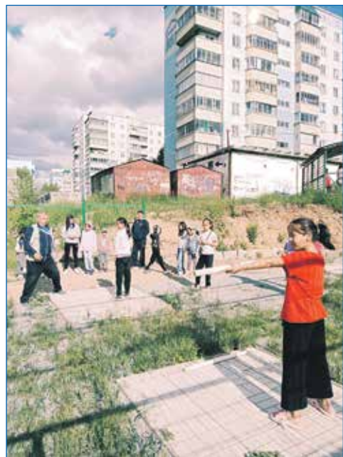
На округе ведется активная работа с детьми

Ведь проблемы, конечно же, возникают у школ, детских садов, центров внеурочной работы не только в момент формирования наказов. Решать их помогает в том числе постоянное взаимодействие с районной и городской администрациями. Уверен, только совместно, сообща можно приносить пользу людям. Во всяком случае, я всегда верен своему слову и, прежде всего, отстаиваю интересы простых новосибирцев.