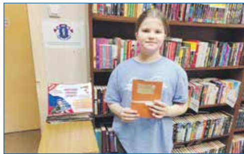
Акция «Новогодняя открытка солдату»

■ Также по программе «Территория детства» была установлена детская игровая площадка во дворе дома по адресу: ул. Высоцкого, 39/3.